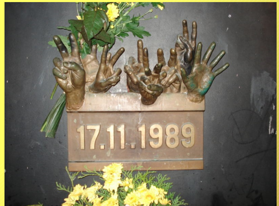
Pamětní deska na Národní třídě