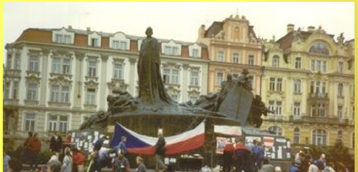
Demontrace na různých místech Prahy