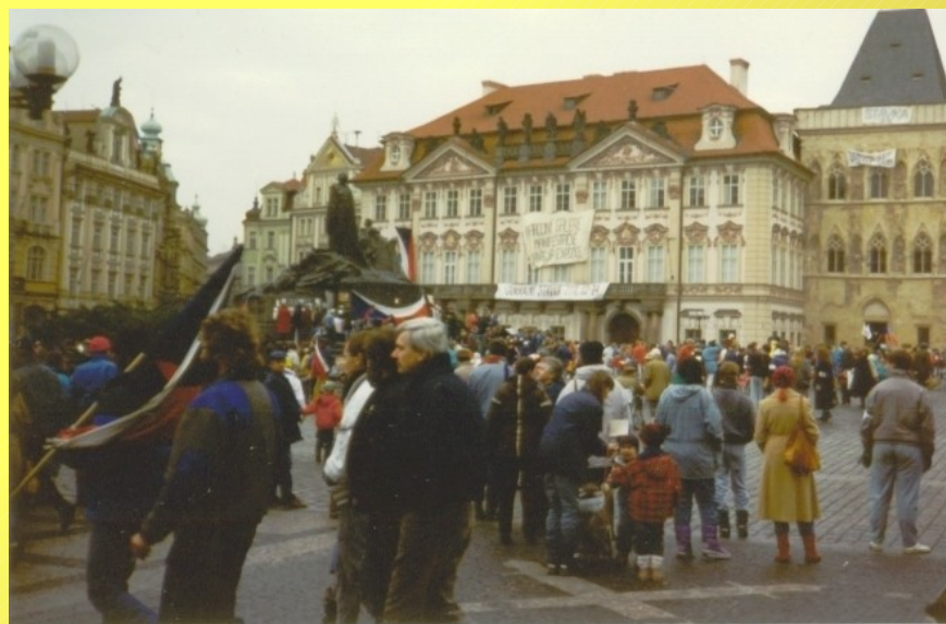
Shromáždění na Staroměstském a Václavském náměstí