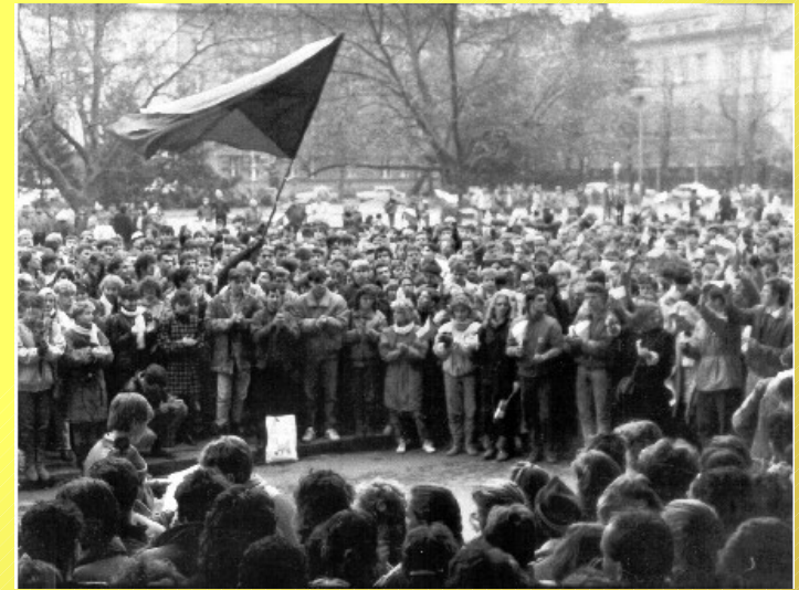
Demostrace v jiných městech – Parbubice, Tábor