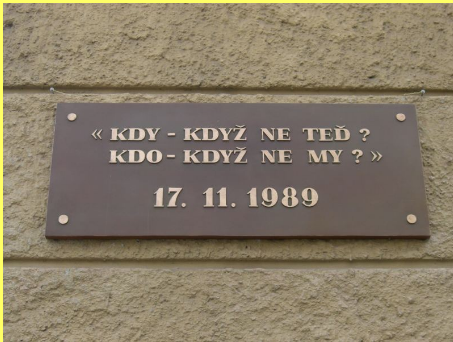
Pamětní deska na Albertově