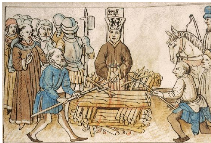
Upálení mistra Jana Husa